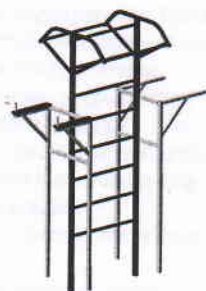
Рис.1 Общий вид