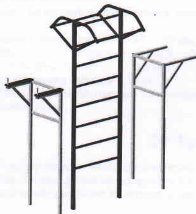
Рис.2 Схема сборки